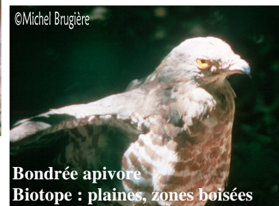
Bondrée apivore Biotope : plaines, zones boisées