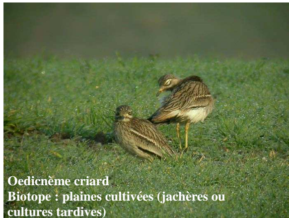
Oedicnème criard Biotope : plaines cultivées (jachères ou cultures tardives)

Pour assurer la conservation des espèces les plus menacées au niveau européen chaque Etat membre doit classer en Zone de Protection Spéciale (ZPS) les sites les plus représentatifs en nombre et en superficie pour la conservation des habitats de ces espèces. Les ZPS intègrent le réseau Natura 2000.