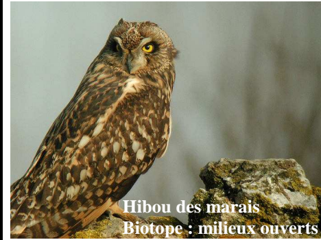
Hibou des marais Biotope : milieux ouverts

Regroupant des habitats naturels où sont présentes des espèces animales et végétales caractéristiques, rares ou encore menacées, ce réseau a un rôle clef pour la sauvegarde des ressources naturelles. La désignation des sites Natura 2000 est réalisée en application du fondement législatif de la directive « Habitats » d'une part et de la directive « Oiseaux » d'autre part.