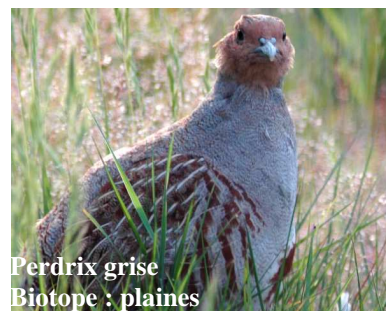
Perdrix grise Biotope : plaines

Aussi, pour chaque site intégré au réseau Natura 2000, les Etats membres s'engagent à maintenir dans un état de conservation favorable les habitats naturels et les espèces d'intérêt communautaire en tenant compte des exigences économiques, sociales et culturelles ainsi que des particularités régionales et locales du site.