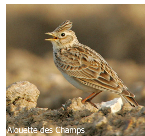
Alouette des Champs