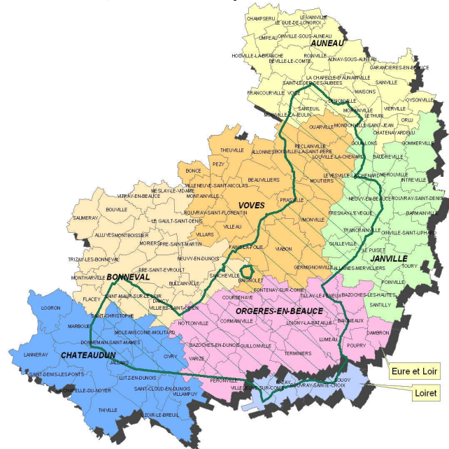
Territoire de la ZPS

Ces mesures de gestion peuvent d'ores et déjà être mises en œuvre de manière volontaire par l'ensemble des usagers (agriculteurs, chasseurs, associations, communes...).