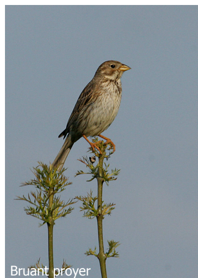
Bruant proyer

Pays de Beauce : www.paysdebeauce.com Pays Dunois : www.pays-dunois.fr Portail Natura 2000 : www.natura2000.fr/