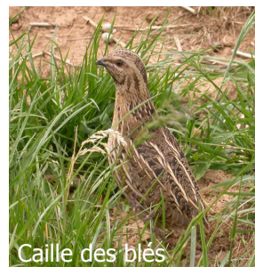
Caille des blés